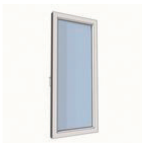
Склеювання для часткового посилення стулок із різною геометрією