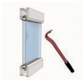
Виготовлення протизламних вікон