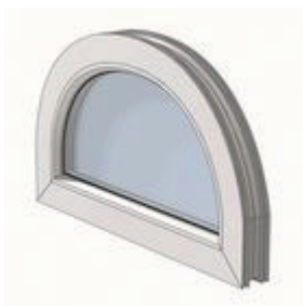
Склеювання профілів, що не мають сталевих вставок (армування)