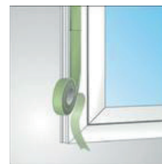
Рис. 2. Спосіб з'єднання стрічки